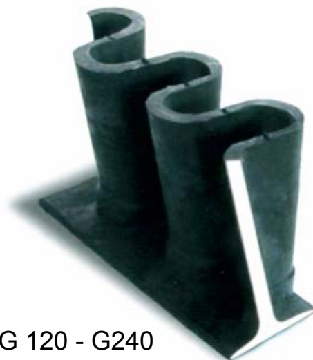
G 120 - G240